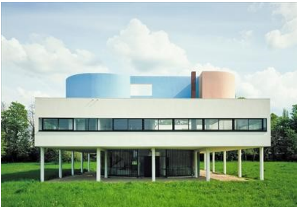
Villa Savoye, 1984

Accès libre, dans la limite des places disponibles